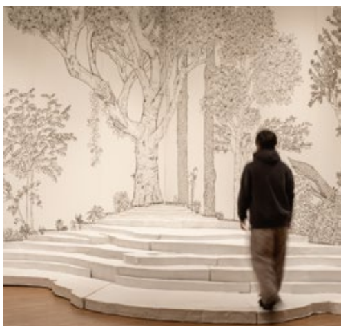
DOUBLE ANNUAL PREVIEW展 京都会場 2023 | ギャラリー・オーブ | 撮影:顧劍亭