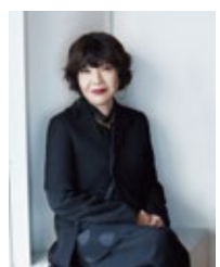
監修 片岡 真実

キュレーター。東北芸術工科大学客員教授、東京芸術大学大学院映像研究科准教授。2020年度・2021年度KUA ANNUALディレクター。アジア各地で新しく生まれる表現活動を調査研究するなかで、異なる領域の応答関係に関心をもち、様々な表現者との協働を軸にしたプロジェクトを展開する。近年の企画に、第58回ヴェネチア・ビエンナーレ国際美術展日本館展示「Cosmo-Eggs | 宇宙の卵」(2019年)がある。